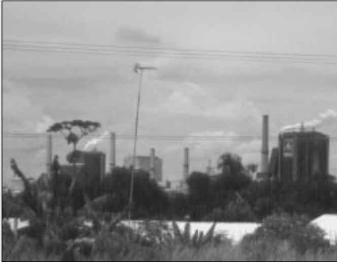
Die Zellstofffabrik Indah Kiat auf Sumatra

Die Unternehmensholding Asia Pulp & Paper (APP) ist ein Musterbeispiel dafür, warum Globalisierung ökonomische, soziale und ökologische Leitplanken braucht. Bereitwillig und mit schier unerschöpflichen Geldreserven ermöglichten internationale Firmen, Banken und Exportkreditagenturen den überdimensionierten Ausbau des Zellstoff- und Papiersektors in Indonesien: innerhalb von nur 10 Jahren wurden die Kapazitäten allein bei APP um das 7-fache gesteigert.