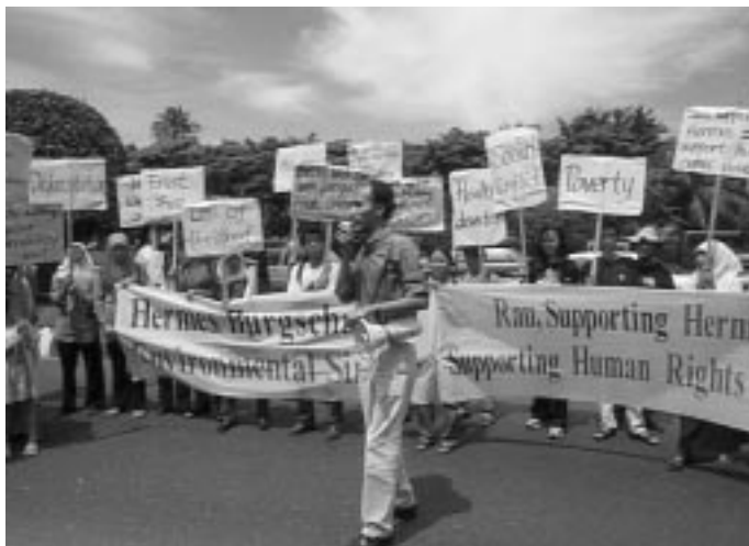
NGO- Proteste gegen deutsche Hermesbürgschaften in Jakarta