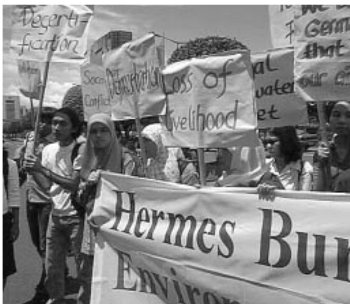
NGO-Proteste gegen deutsche Hermesbürgschaften in Jakarta

Die UN-Umwelt- und Entwicklungskonferenz in Johannesburg hat es deutlich gezeigt – die globale Politik steckt in einer Sackgasse. Eine Kehrtwende bei den drängendsten Problemen Armutsbekämpfung und Umweltzerstörung liegt in weiter Ferne. Noch immer leben nach Angaben der UN auf unserem Planeten 1,2 Mrd. Menschen in absoluter Armut und noch immer verbrauchen 20 % der Weltbevölkerung etwa 80 % der Weltressourcen 1 .